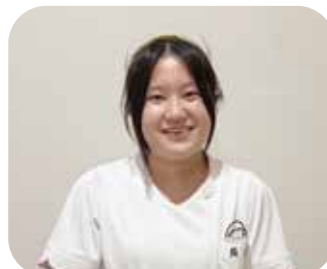
コープリハビリテーション病院 回リ八病棟 看護師 長 副 緋 里