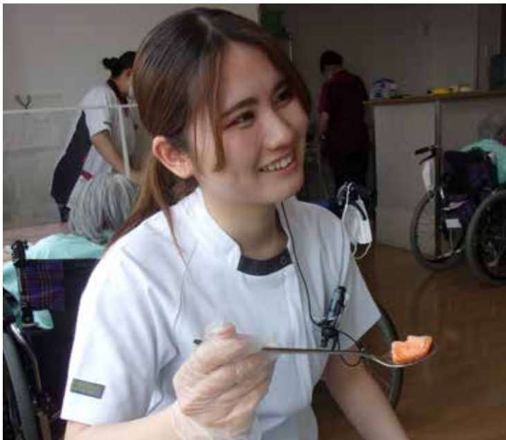
安全な食事形態から嚥下訓練を行う筆者

老健あかねは、通所リハビリ・訪問リハビリ・短時間通所リハビリとの連携をしています。