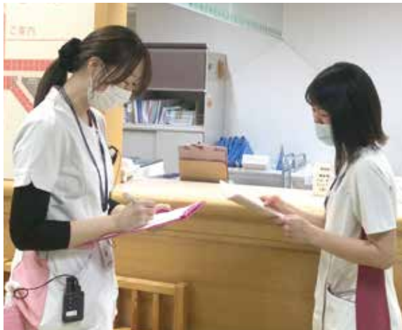
当院担当看護師(写真左)と倉敷中央病院看護師(写真右)との打合せ