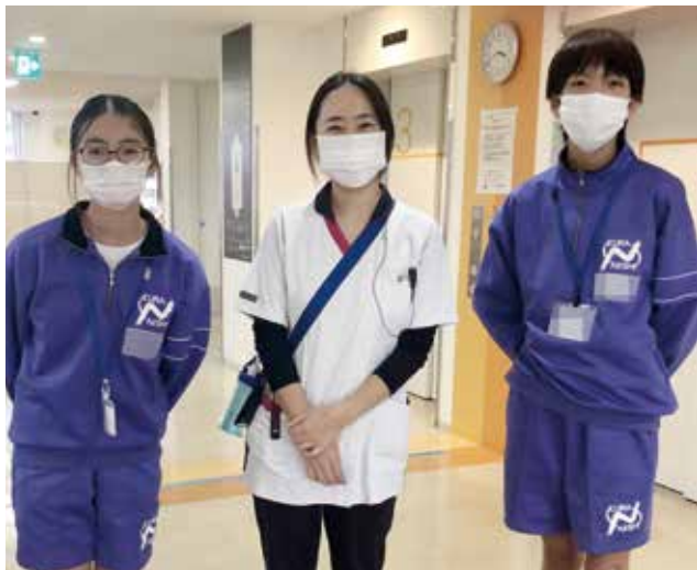
参加された2人の生徒

2025年11月に3日間、倉敷市立西中学校2年生の方2名がチャレンジワークで3階回復期リハビリテーション病棟へ来られました。医療従事者に興味があるとのこと、看護だけでなく、管理栄養士さんの説明も聞いていただきました。看護では血圧測