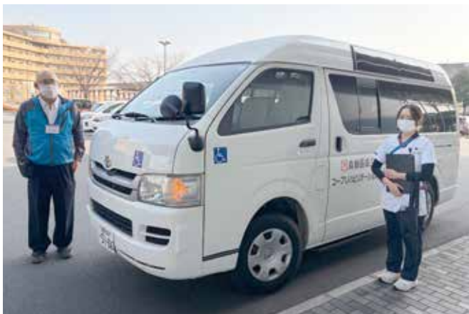
お迎えに向かう当院看護師とドライバー

コープリハビリテーション病院は、川崎医科大学附属病院と倉敷中央病院との連携病院です。