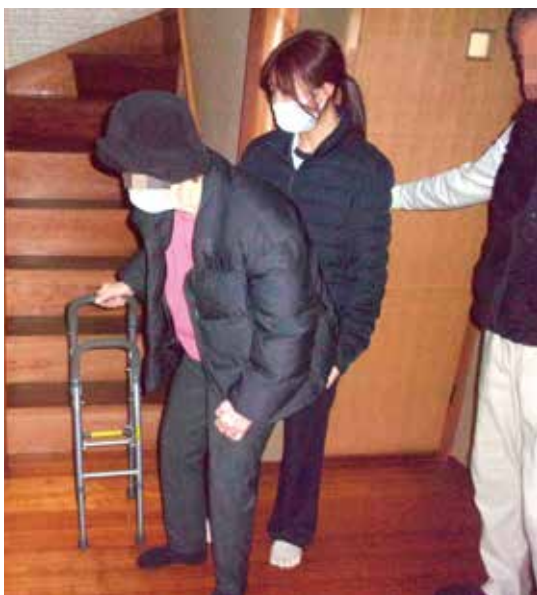
自宅で奥様の動作を間近に見ることで、旦那様も退院後の生活イメージがつかめたようです

【まずはベッド周囲の自立が ら】 慢性硬膜下血腫発症後の3ヶ月後に脳梗塞を発症し、寝たきり状態となった方を担当しました。まずはベッド周囲動作の自立を目標とし、基本動作再学習を中心にリハビリを実施しました。入院後1ヶ月後からベッド起居が可能に、2ヶ月後に車椅子移乗が可能となりました。3ヶ月後には歩行が短下肢装具とサイドケ