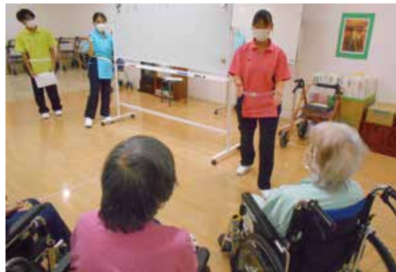
実際の利用者との交流を通じて学校での勉強を深めて介護計画立案に活かします