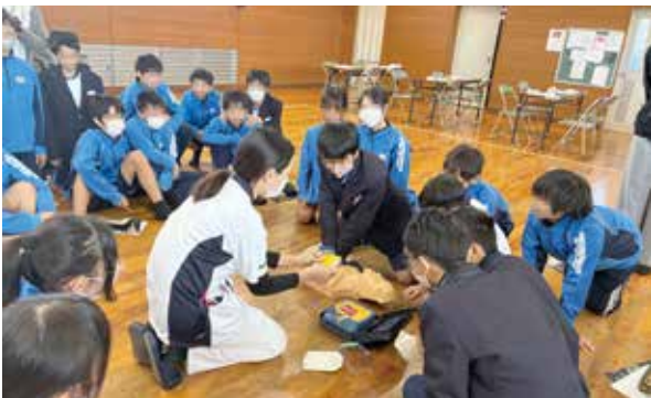
生徒参加型のAED操作体験

行うことに緊張や不安な様子が見られました。ですが、声の掛け方で利用者様の「できる」を増やせることや、利用者様の残存機能を意識した介助の仕方など、利用者様一人ひとりに合った個別支援をしていることに気づくことが出来ていました。 学校で勉強するだけでなく、実際に利用者様と関わることでより理解が深まったのではないかと思います。 今回の実習での学びを活かし、立派な介護福祉士になっ てくれることを期待しています。