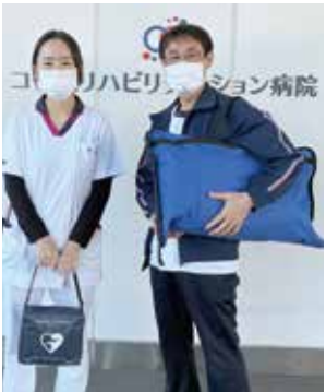
中学生実習に向かう2人