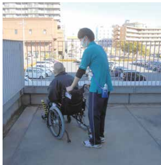
テラスから施設外部を臨む

印象的でした。担当利用者様を決め情報収集・ケアプランの立案・実施・評価、それに加え毎日の記録を頑張っていました。ケアプランの立案などうまく文章に出来ず困っていました。