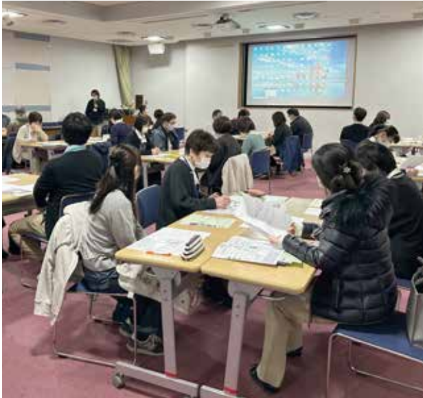
一堂に集まった地域のケアマネージャー

コープリハビリテーション病院は、川崎医科大学附属病院と倉敷中央病院との連携病院です。