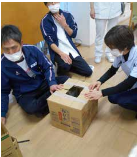
トイレが使用できなくなった時の対応として段ボールトイレを作りました

老健あかねは、通所リハビリ・訪問リハビリ・短時間通所リハビリとの連携をしています。