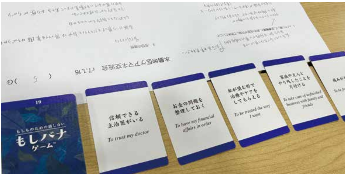
「もしバナゲーム」を体験しました

水島地区ケアマネ交流会が1月16日にライフパーク倉敷にて開催されました。 この交流会は、水島地域連携ネットワーク会議と、水島地域の高齢者支援センターが合同で企画し、ケアマネージャーとの学習や交流を目的に年1回開催されています。 今回もケアマネージャー、保健師、看護師、