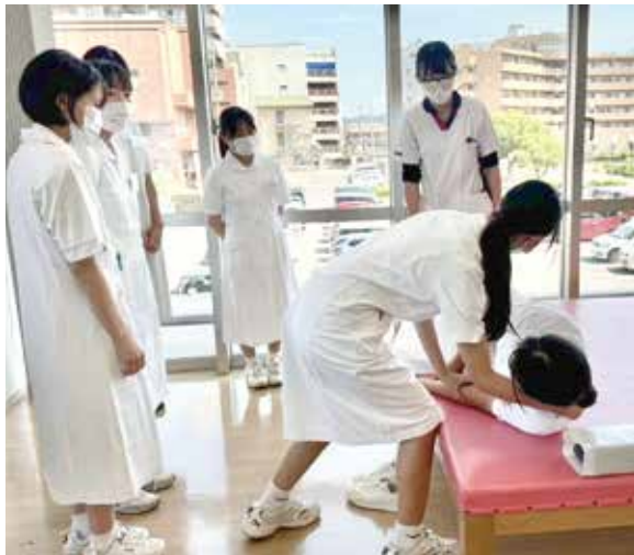
リハビリ室で起き上がりの体験

今回は高校2年生の参加が多く、看護大学への進学を見据えているものの迷っていたり、そもそも将来何になりたいのか迷っている生徒