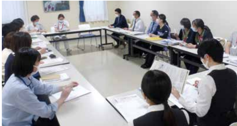
定例の水島ネットワーク会議

また、ネットワーク活動を行うにあたり、水島ではこんなところに力をいれているよ、いいところだよ、というアピールも必要だと思ったり仰っていました。地域を大事に思い、患者さんに寄り添っておられる印象でした。訪問することでその医院の雰囲気や先生の人柄にも触れることができ貴重な体験でした。水島の連携を