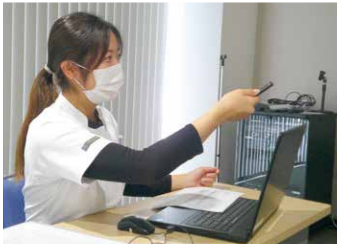
リハビリ新人発表をしている筆者

細菌性肺炎後の嚥下障害を呈した症例について発表しました。入院当初は嚥下障害に対する現状理解が難しくリハビリに対して拒否もみられていました。