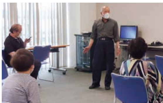
林町内会長さんから挨拶

7月から毎月第2水、第4金の開催を予定しています。お申込みは水島高齢者支援センターです。参加しました。