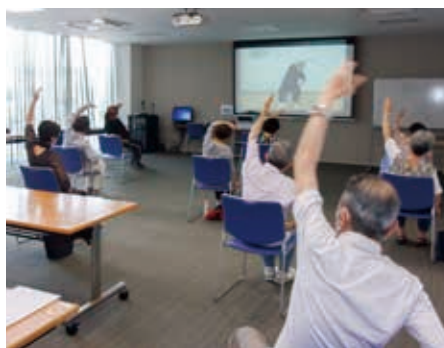
久しぶりの百歳体操

林町内会長さんから「再開できた喜びと感染拡大の心配の両方を持った再開となりました。感染防止により外出を控え、普段よりも運動不足を感じています。感染予防として、隣の人の距離も十分に取ります、運動が出来る工夫をしています。他の地域でも同じような対策をしているようです。お互いに体調に気をつけながら、運動不足を解消していきたいでしょう。」と挨拶されました。