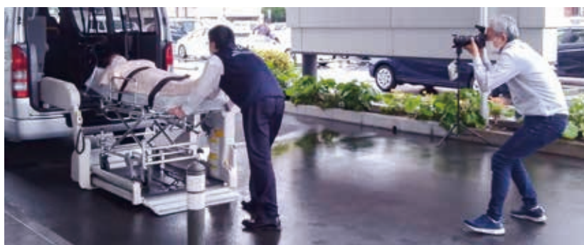
建物をバックに自社車輛をアピール