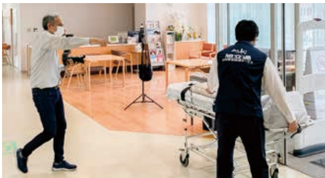
プロの指示でよりリアルな搬送現場を作る