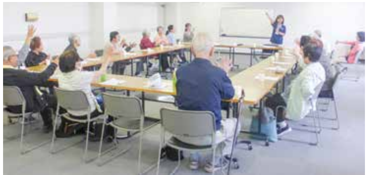
きずなの会総会参加者による体操

きずなの会は、障害のあ る方、認知症のある方の介 護者自身が作っている会で す。日頃なかなか言えない 今までの介護の苦労や、今 の思いなどを語り合いまし た。「いつもは家で誰とも話 をすることはないけど、こ こに来ると皆と話ができる から、楽しみにしている」 と話して下さる方や、「病院 で何度か会いましたよね」