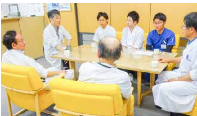
医局で先輩医師たちと懇談