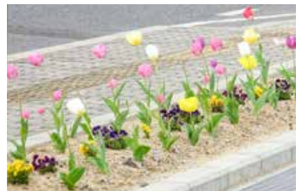
花壇ボランティア (4月)