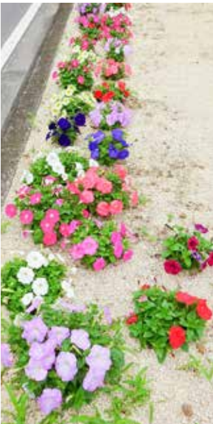
綺麗に開花したペチュニア (5月)