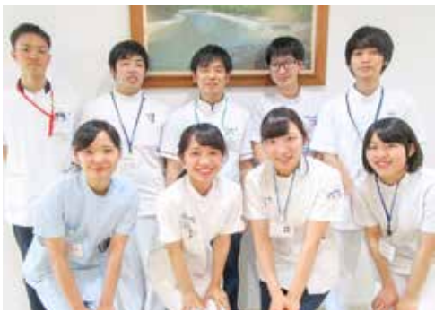
実習に望む9名の実習生

今年には理学療法士14名、作 業療法士7名、言語聴覚士4 名の合計25名の実習生を受 け入れる予定です。特に5月 は9名と多くの実習生が集っ ています。実習中は患者さん の協力も得て、自宅に向けて 何が必要となるかの学習をし ています。知識・技術に加え 何が患者さんやご家族の負担 となるのか介護力や生活背景 にも目を向けた関わりが取れ るようにしています。