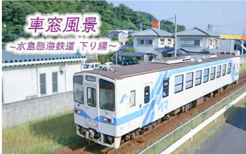
番組オープニングの水島臨海鉄道の車両

水島臨海鉄道の「車窓風景」という番組を倉敷ケーブルテレビでご覧になったことがありませんか。何とコープリハビリテーション病院が紹介されているのです。先日、その「ピーポー車窓ガイド」に携わった倉敷中央高校へお礼と取材に行ってきました。残念ながら担当された生徒の皆さんは卒業されたとのことでしたが校長先生・教頭先生・福祉科の先生が対応してくださり「りんとつ沿線手帳」や新聞切り抜きなどいただいた