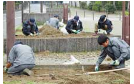
チーム未来の方々 (4月)

実習生が担当となることで 迷惑をかける場面もありま すが、反面実習生が担当す ることで「もっと頑張らな いといけない」と奮起される方も 居られます。我々は、「実習 生効果」と評していますが、 一時的な効果とまらないよう に気を引き締めて行きたいで す。実習生の受け入れは大変 な業務ですが、実習生や指導 者の双方に取って良い取り組 みであり、今後も継続してい きます。