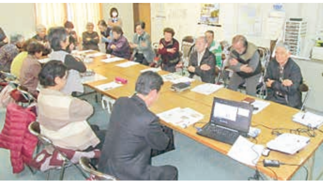
にんにんサロン開催に向けて小地域ケア会議での打合せ

ハビリテーション病棟だけでなく、老健でもしっかりとしたりハビリを行い、退院後は通所リハビリや外来リハビリを通して機能維持・現状把握を行うことで、ご本人・ご家族ともに活気をもって安心して生活できるのではないかと思います。