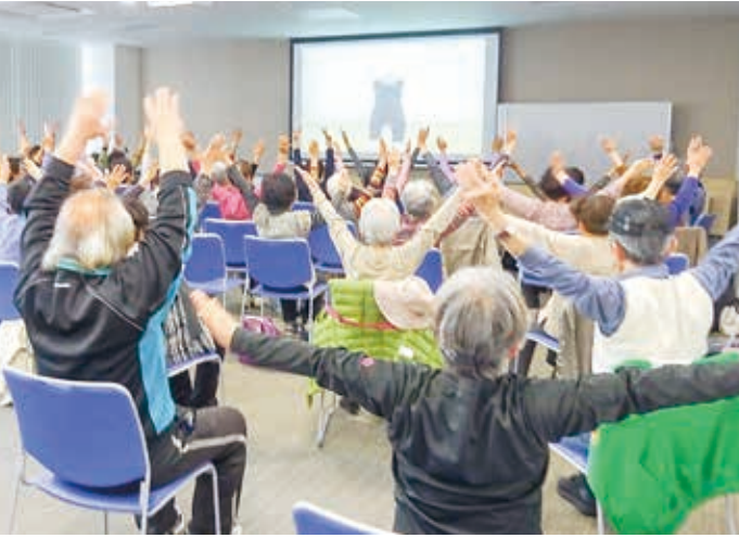
地域の方々が運営する「にんにんサロン」(4月10日)

地域住人の集うサロンが当院で開催される事は非常に心強く、今後にも多くの可能性を秘めています。当院でも建物丸ごとリハビリテーションをスローガンに外来リハビリ、健幸アップ教室、通所リハビリと様々な事業を展開しています。リハビリ後に元気になったものの卒業を迎えると不安があります。せっかく元気になったのに次に活かす場面がないのはもったいないです。そんな時にサロンへ合流し、自分の体験した事や学んだ運動を地域の方へ知らせ、他の人も巻き込んで健康になるのは最高の場と